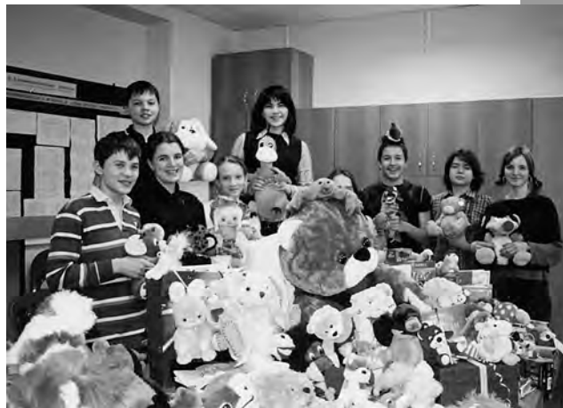
Для акции милосердия мы, ученики АШ, собрали много подарков воспитанникам детского дома.