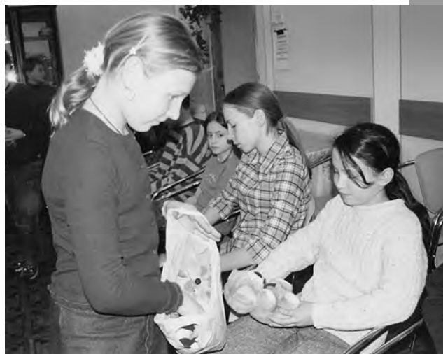
Потом каждому ребенку мы вручили пусть маааенькую, но предназначенную именно ему игрушку.