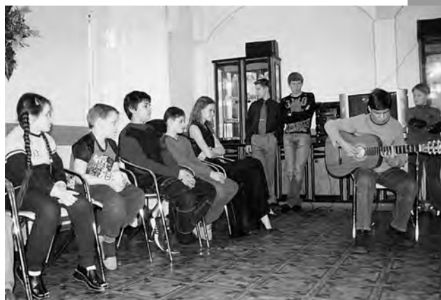
Еще мы подготовили для ребят интересные выступления, а это дороже любых подарков.