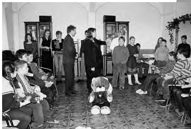
На этой встрече царил удивительная атмосфера дружбы, понимания и сопереживания. Нам было очень приятно видеть счастливые глаза ребят...