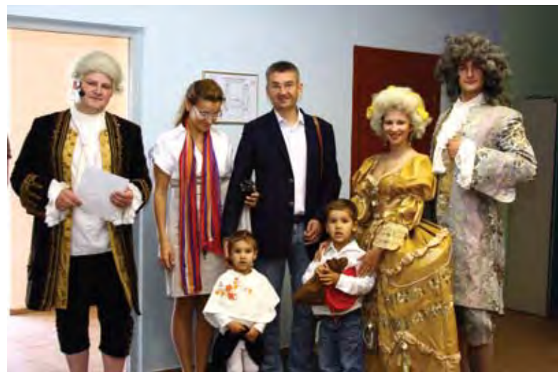
М. В. Ломоносов для учеников и родителей – главный распорядитель школьного праздника