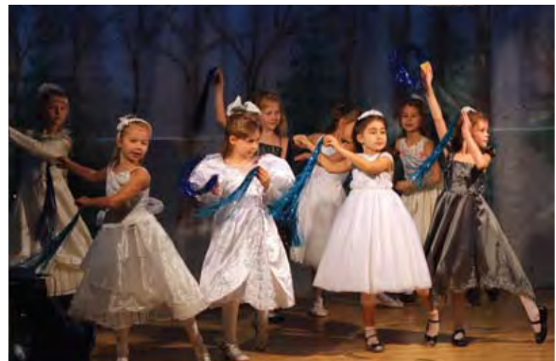
Наш волшебный танец

А сегодня мы встречаем праздник в нашей любимой Ломоносовской школе.