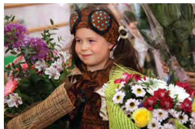
«Приходите в гости!»