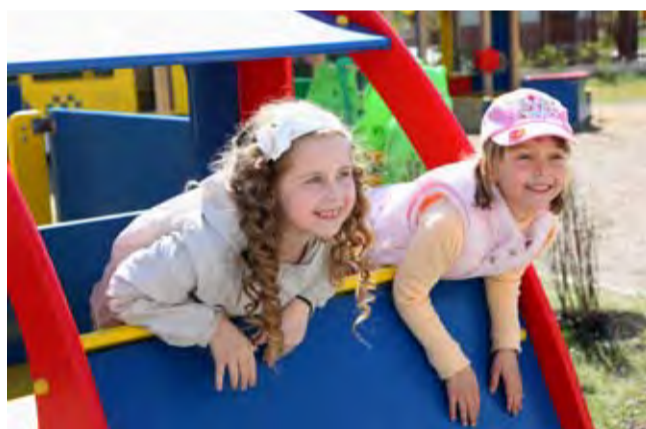
Скоро в школу! Ура!

В добрый путь! Мы ждём вас в Ломоносовской школе!