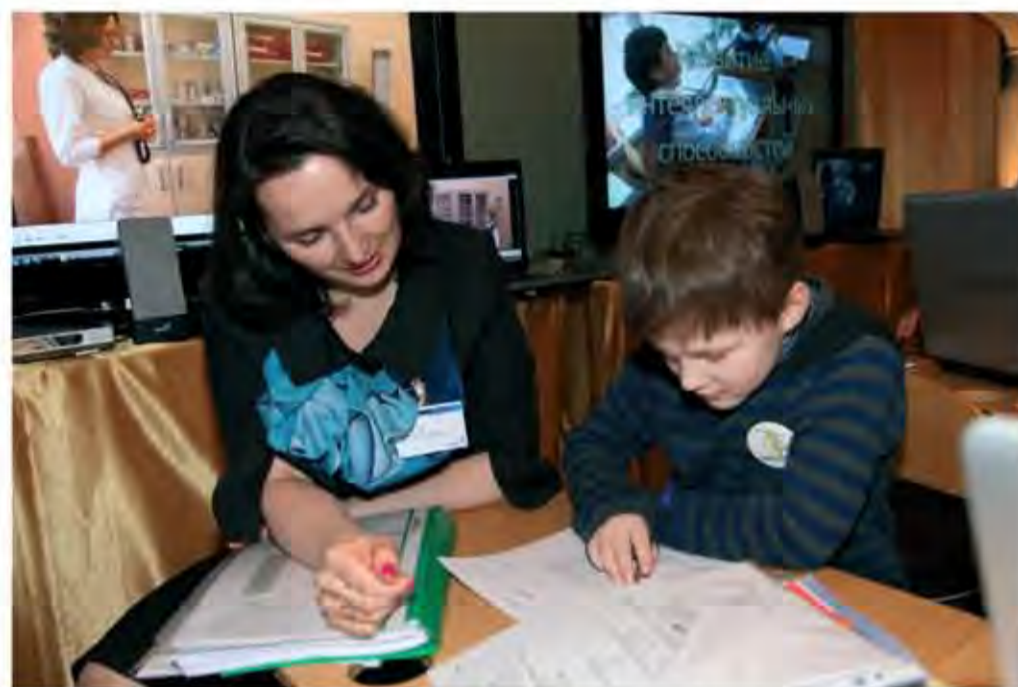
Одним из приоритетных направлений образования в Ломоносовской школе является интеллектуальное развитие.