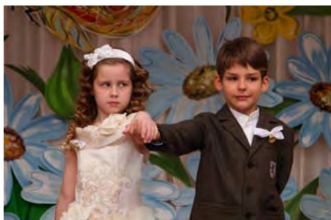
Может, сядем за одну парту?