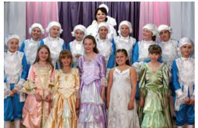
Один опыт я ставлю выше, чем тысячу мнений...