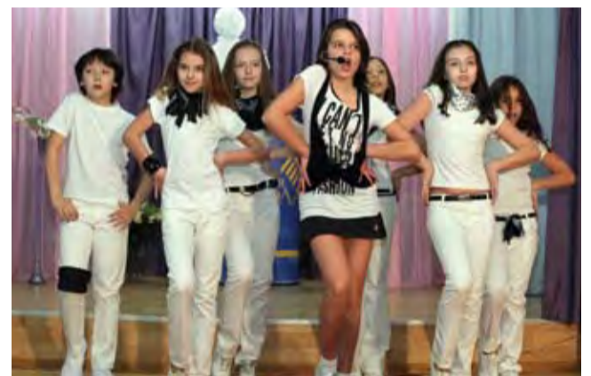
Только в ... смелости и энергии родится победа