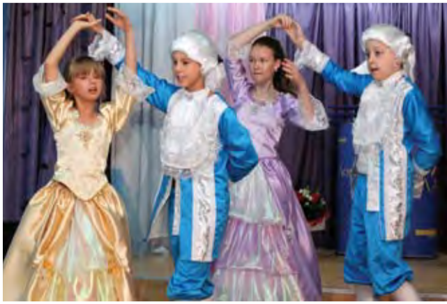
Везде исследуйте всечасно, что есть велико и прекрасно