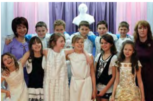
Неусыпный труд все препятствия преодолевает