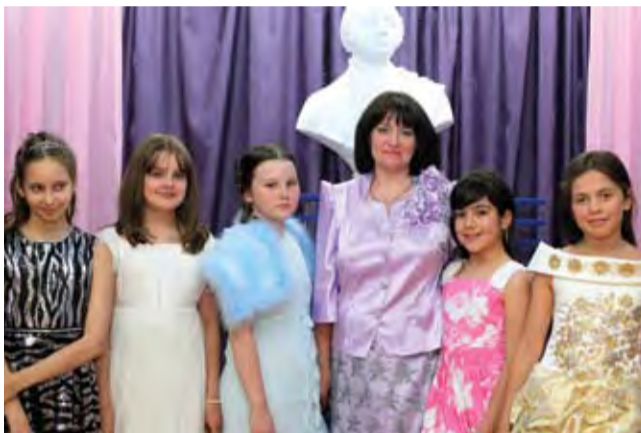
Труд минется, а хорошее останется