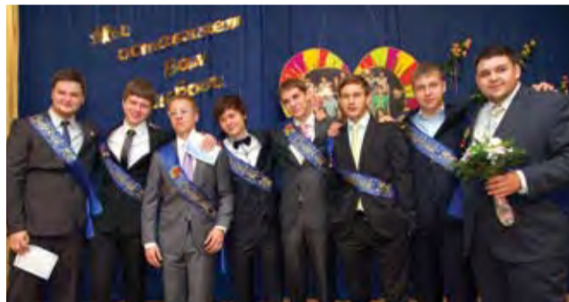
Мы не прощаемся!