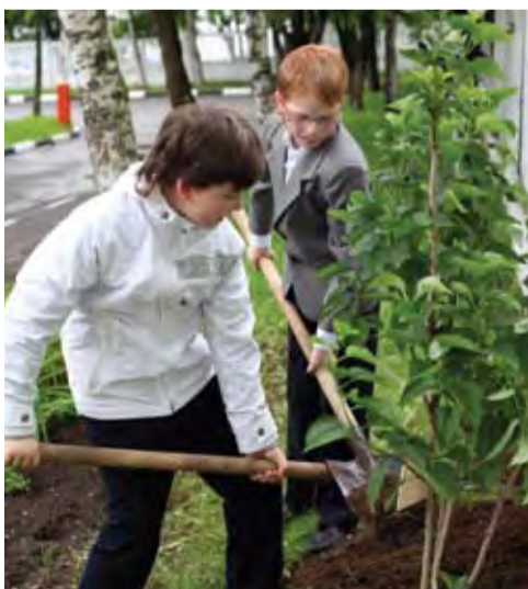
В молодых годах должно от роскоши удаляться...