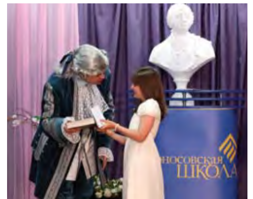
Держайте Отчизну мужеством прославить!