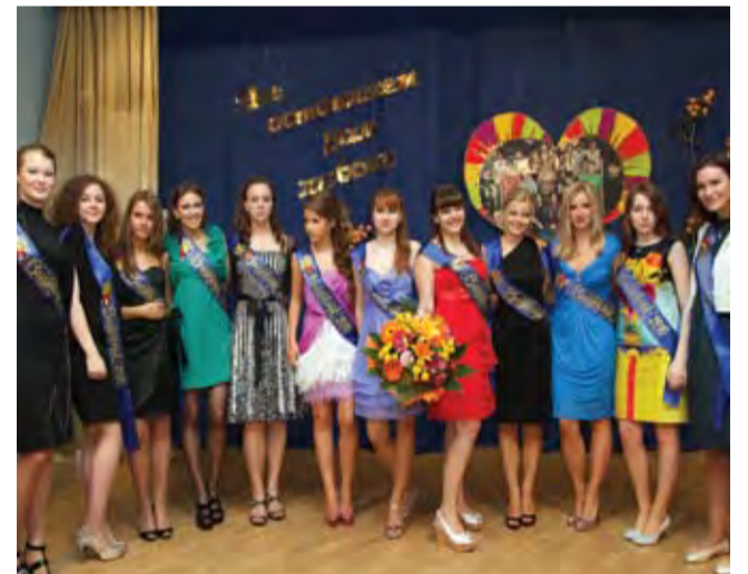
Интеллектуальная красота спасёт мир!

ЭТА СТАТЬЯ – ЗАЧЁТНАЯ РАБОТА ВЕДУЩЕГО ЖУРНАЛИСТА ГАЗЕТЫ «ЛОМОНОСОВЕЦ» ПО ДИСЦИПЛИНЕ «ВВЕДЕНИЕ В СПЕЦИАЛЬНОСТЬ»: