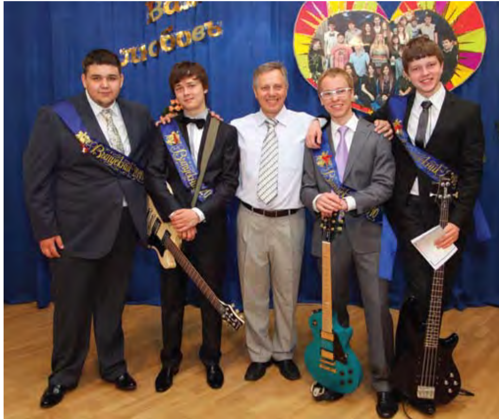
Друзья не расстаются навсегда...

С чувством глубокого волнения вспоминаю то время, когда пришёл в 5 класс для того, чтобы найти ребят, желающих учиться играть на гитаре.