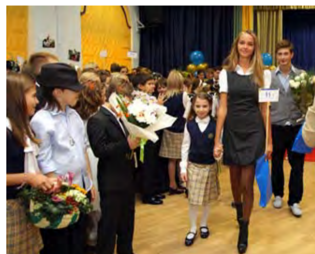
Мы помним школьное детство...