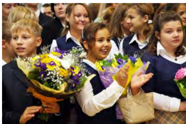
... и радуемся: «Здравствуй, школа!»