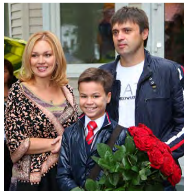
1 сентября – семейный праздник в Ломоносовской школе