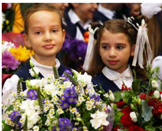
Грустим мы: «До свиданья, лето»...