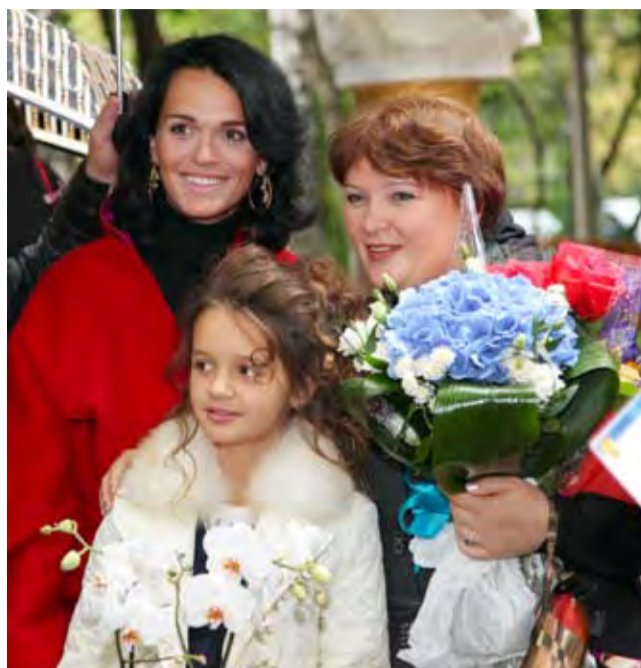
Славное начало нового учебного года