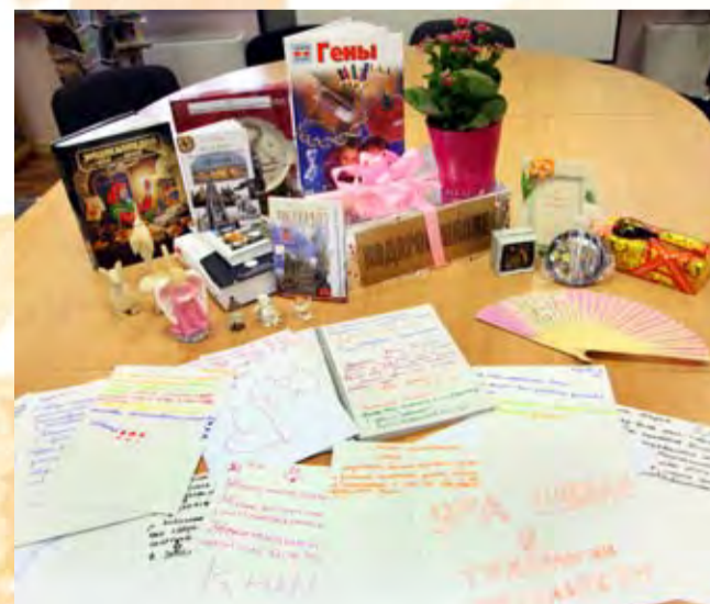
Подарки любимой школе