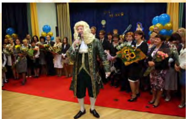
Счастлив посетить столь дорогое собрание!

С праздником, наша любимая Ломоносовская школа!