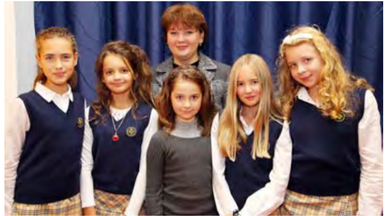
С новым учебным годом!

Лучезарная улыбка Освещает весь наш класс, А мечтательность и смелость Очаровывает нас.