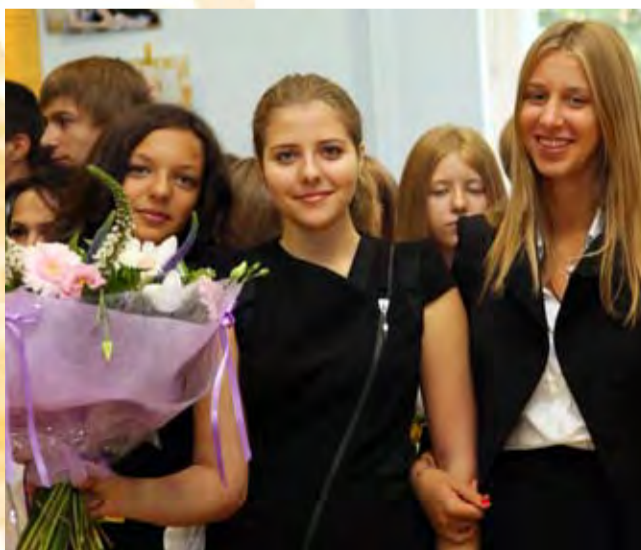
Школьные годы чудесные!