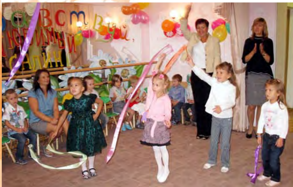
Наконец-то мы вместе!