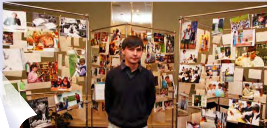
I Международная фотовыставка «Образование через объектив»