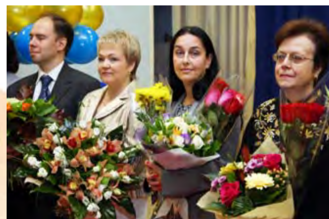
Год Учителя будет успешным!