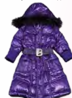
пальто Laura Biagiotti

качество материалов и современный дизайн.