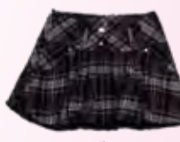
юбка Laura Biagiotti