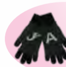
перчатки Armani junior