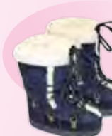
унты D&G junior