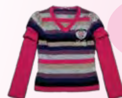
джемпер Laura Biagiotti