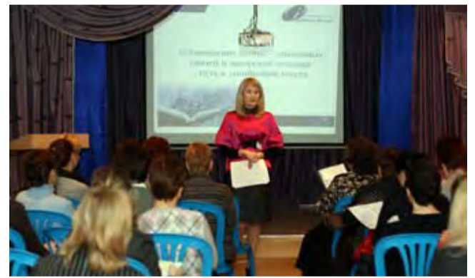
Начальная Ломоносовская школа ежегодно проводит семинары по чтению для учителей Москвы и Подмосквья