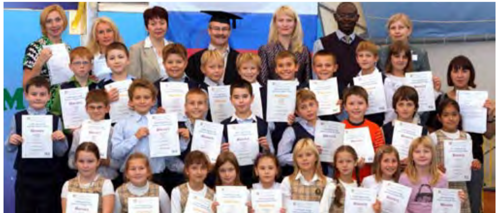
Ученики начальной школы успешно сдают международные экзамены