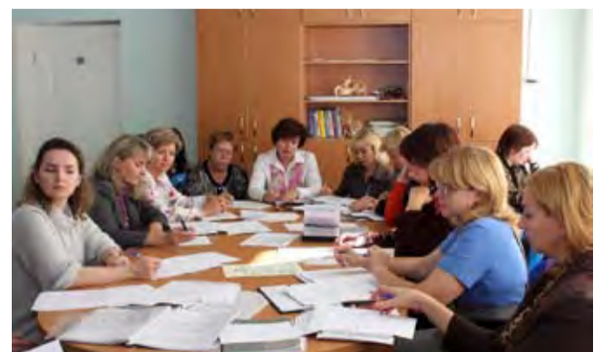
Коллектив начальной Ломоносовки постоянно совершенствует своё мастерство

Правнучка М. В. Ломоносова Мария Волконская – знаменитая княгиня, блиставшая на балах. Ей было 20 лет, когда она сразу после рождения ребёнка уехала за мужем-декабристом на каторгу.