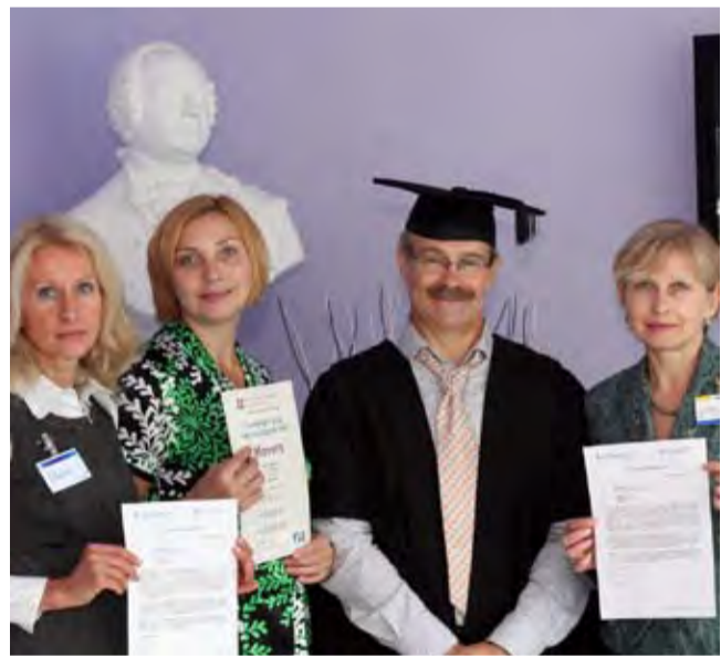
Учителя английского языка сотрудничают со специалистами Кембриджа