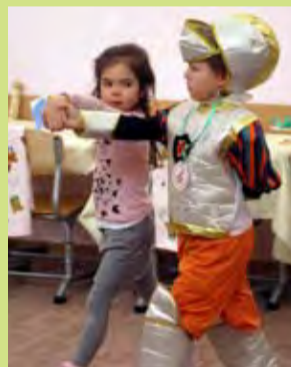
Танец для замка