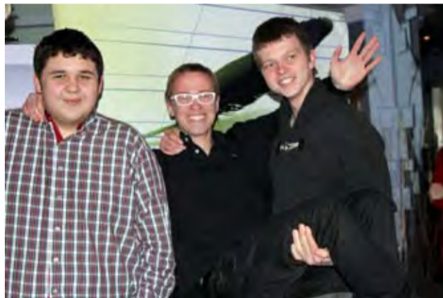
Мы ещё споём!