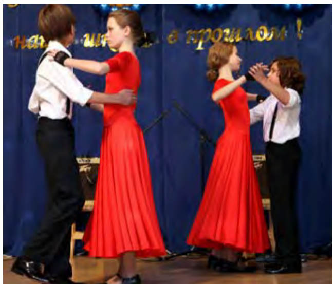
Смотрите, выпускники, какие мы взрослые