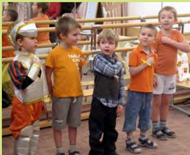
Будем защищать всех дам