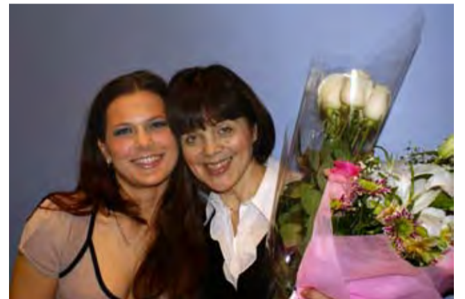
Весеннее настроение в феврале