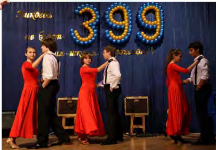
Ах, это танго!