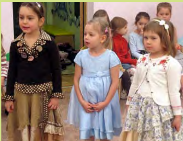
У нас самые замечательные мальчики