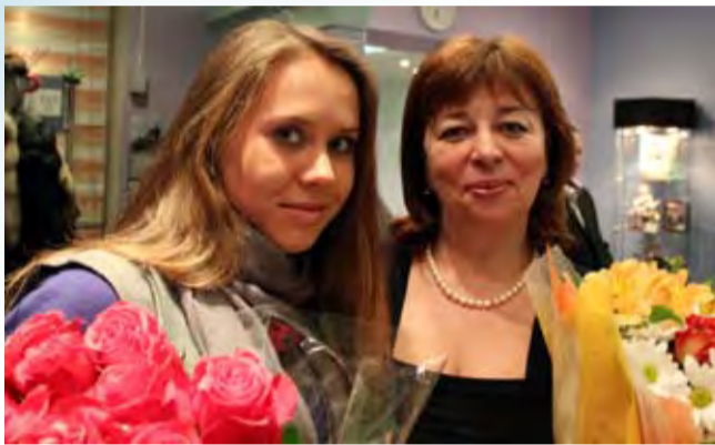
Моя любимая Ломоносовка!