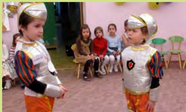
Посвящение в рыцари