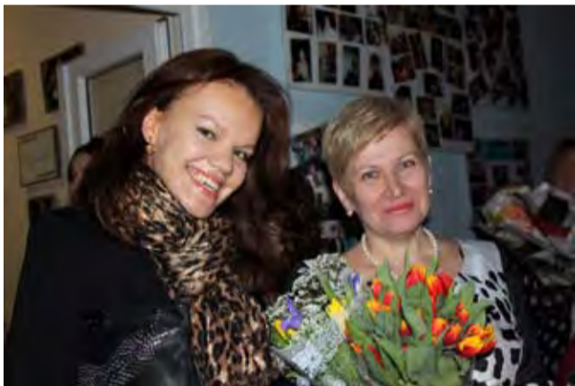
Школа, я скучаю по тебе