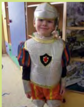
Благородный и бесстрашный