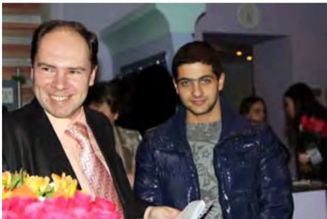
Мы из Ломоносовской