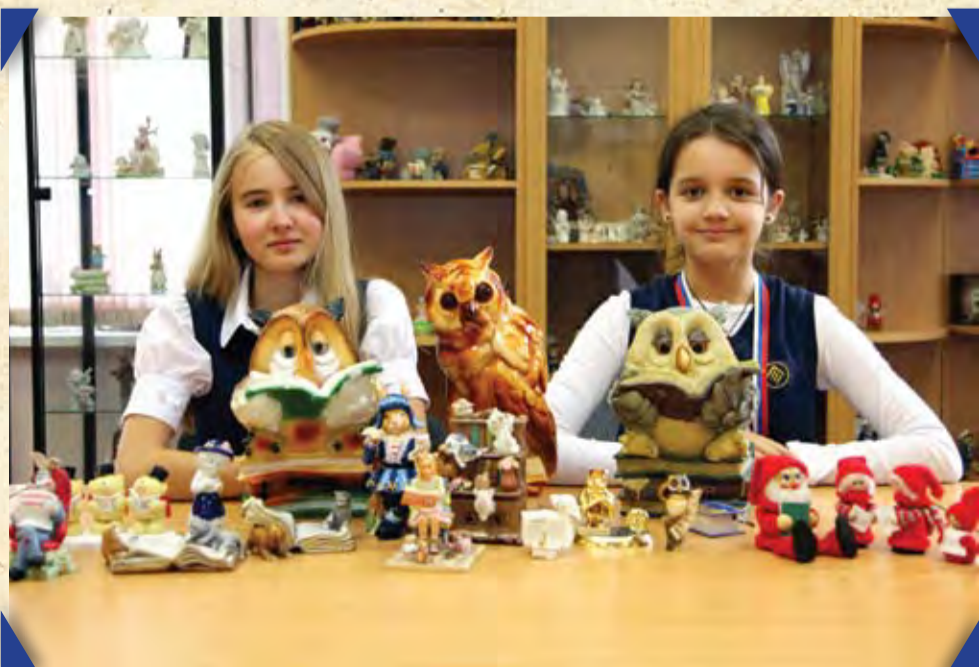
Школьная коллекция читающих фигурок