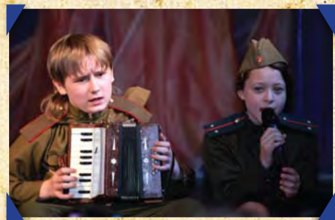
Песни военных лет