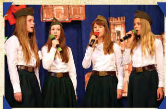
Для вас, ветераны