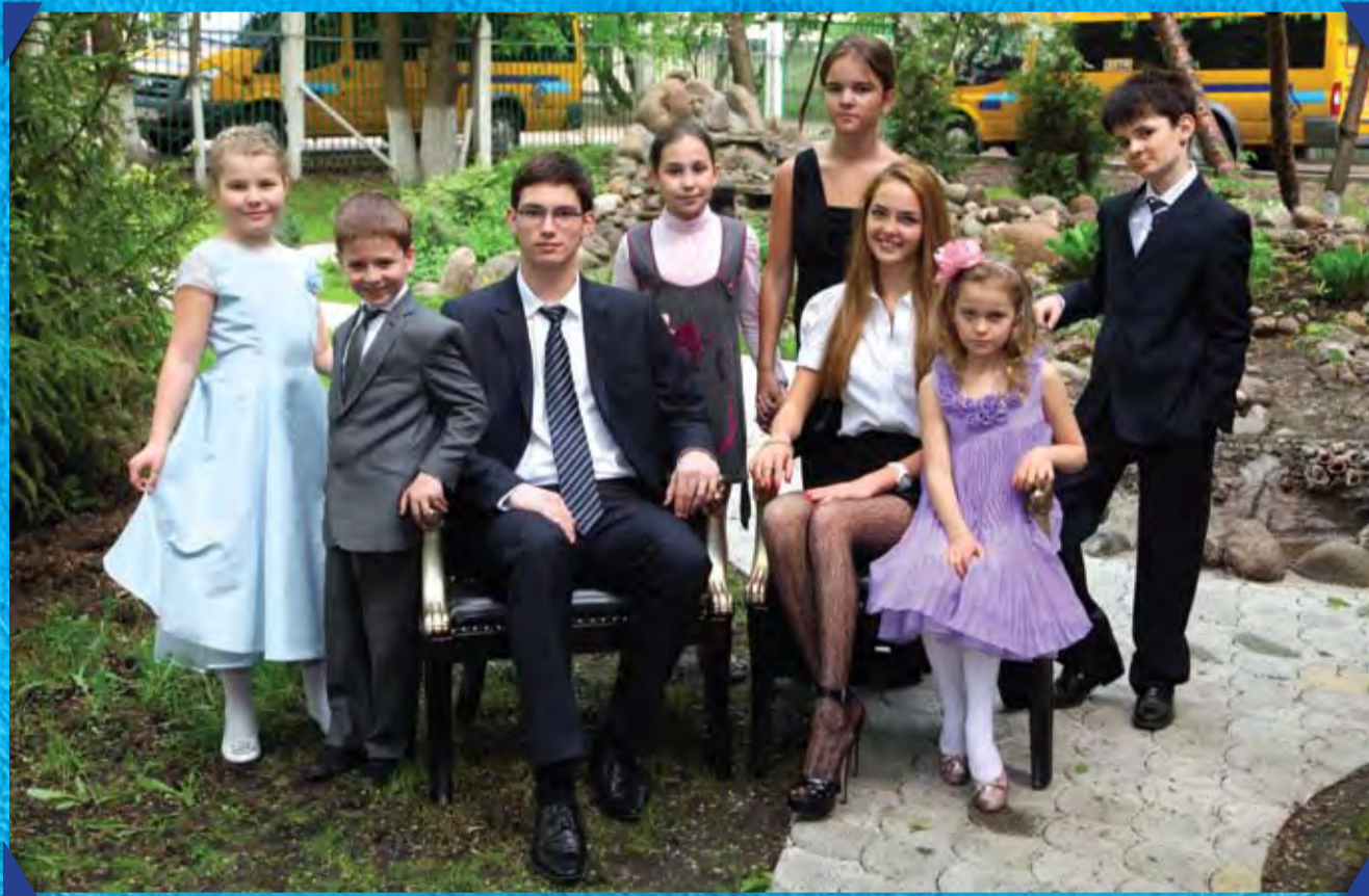
Мы - выпускники!

— В третьем классе я мечтал поскорее окончить школу. Устал учиться. И вот сейчас моя мечта сбывается. Мне и грустно, и весело. Начинается новая жизнь, которую я хочу связать с политикой. Хочу нашу страну сделать лучше. Грандиозных планов профессионального будущего пока не задумал, а вот о счастливой семье мечтаю. Уверен, что одному ребёнку в семье скучно. Для своих детей я бы выбрал Ломоносовскую школу.