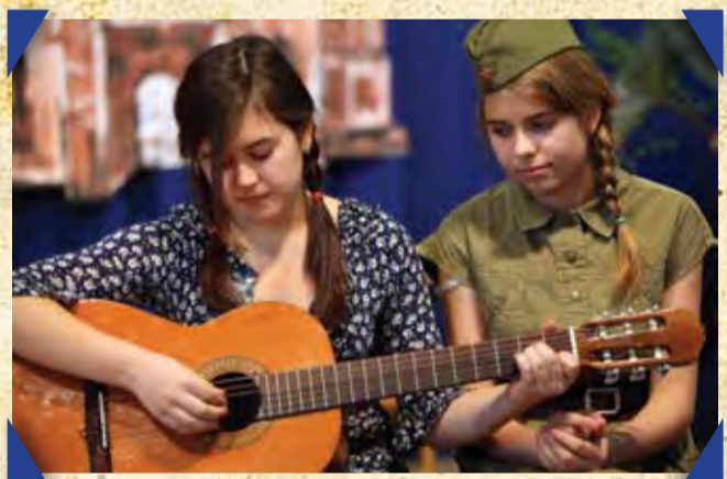
Посвящается детям войны