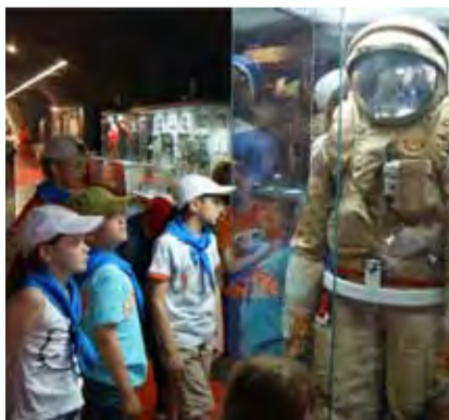
Музей космонавтики. Экспедиция «Открытый космос»