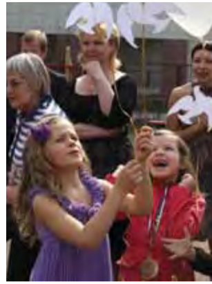
Весёлая игра Ломоносовский детский сад