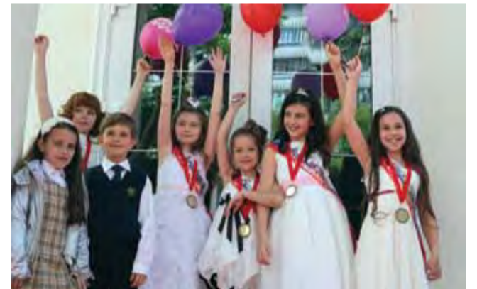
С радостью смотрим в будущее Начальная Ломоносовская школа