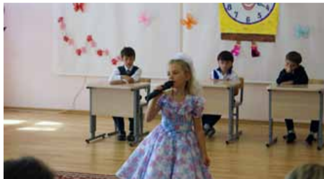
Песня для самых дорогих Детский сад Ломоносовской школы – Зелёный мыс