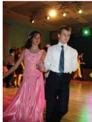
Среди шумного бала...