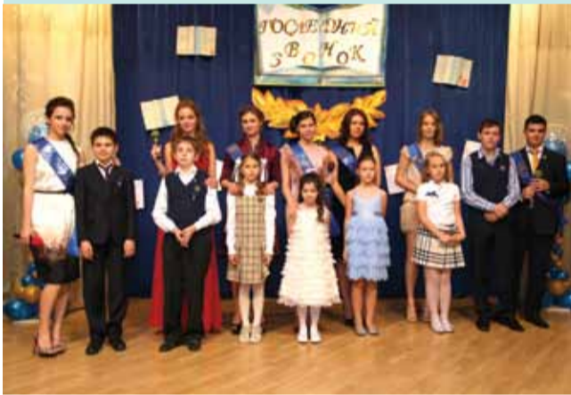
Братья и сёстры