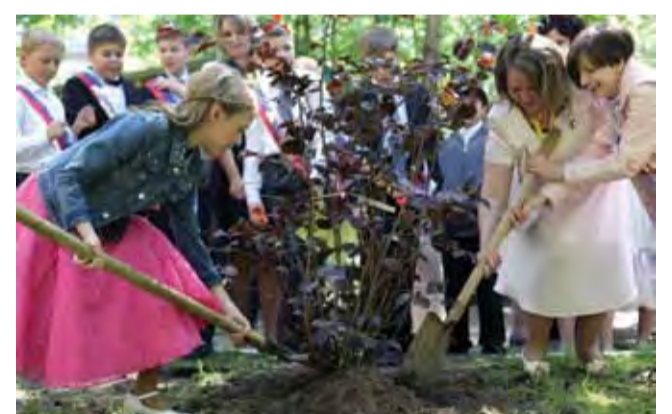
На память от выпускников Начальная Ломоносовская школа

Дорогие четвероклассники! Вот и пройден вами очень важный период жизни – период обучения в начальной школе. Четыре года назад у вас все только начиналось. Первый учитель, первый звонок, первый урок. Первые трудности и первые победы. Такие моменты оста-