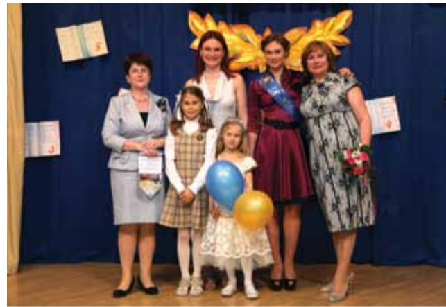
Мы все — ломосовцы!