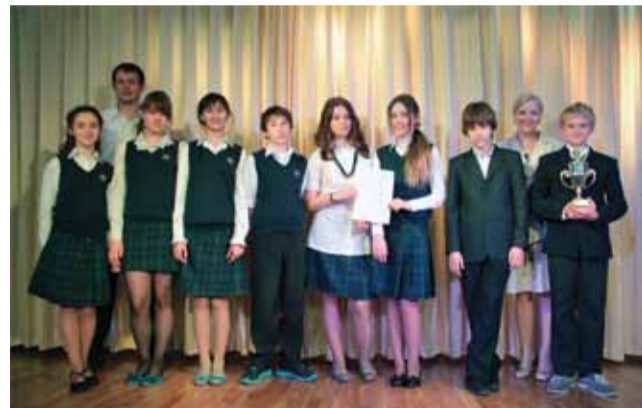
7 класс – победители Ломоносовского конкурса «Класс года – 2011»