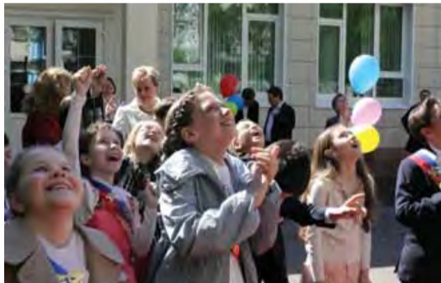
Пусть сбудутся мечты! Начальная Ломоносовская школа