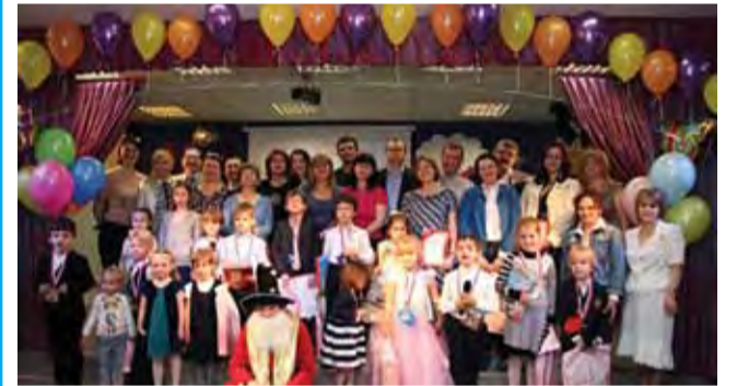
В первый класс! Нулевой класс Ломоносовской школы «ИнТек»