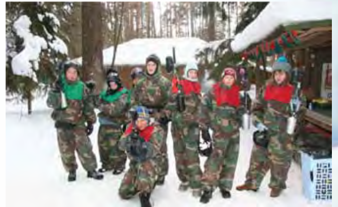
«Бухта радости 2011»