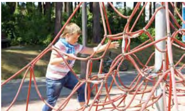
Через тернии к звездам. Космическая подготовка курсантов