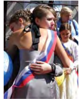
Вместе с первого класса