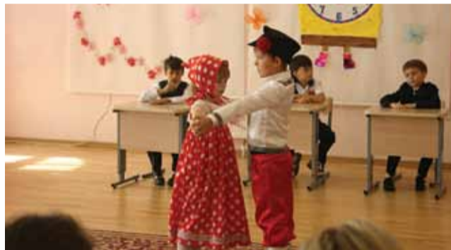
Весёлый перепляс Детский сад Ломоносовской школы – Зелёный мыс