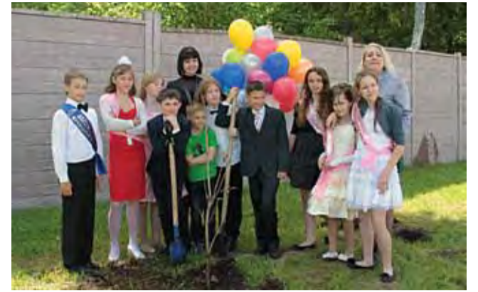
Прощай, начальная школа Ломоносовская школа – Зеленый мыс