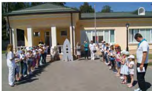
Открытие смены. Линейка