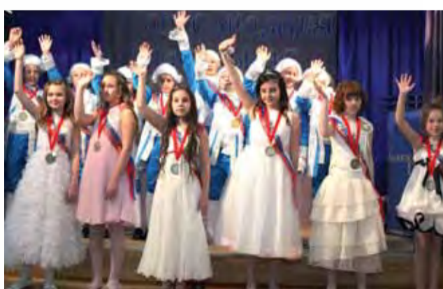
Самый творческий 4б класс Начальная Ломоносовская школа