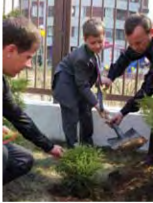
Дерево на память Ломоносовский детский сад