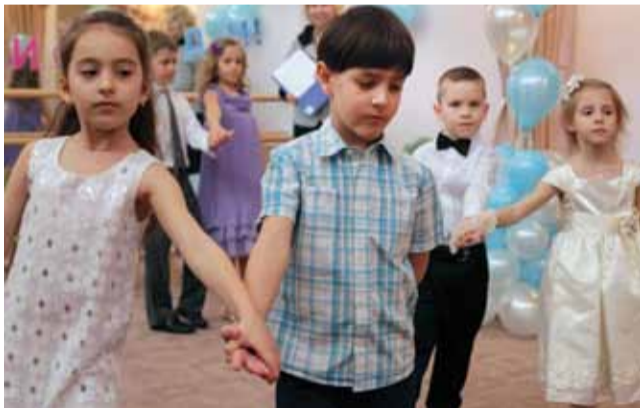
Торжественный выход Ломоносовский детский сад

Как быстро подрастают дети! Кажется, только вчера они пришли первый раз с мамами за ручку в наш детский сад – и вот они уже почти первоклассники. Выпуск в школу – приятная дата! Выпуск 2011 года особенно знаменателен 300-летним юбилеем В.М.Ломоносова, готовиться к которому наши выпускники начали еще дошколятами, а праздновать будут уже настоящими школьниками в стенах любимой Ломоносовки.