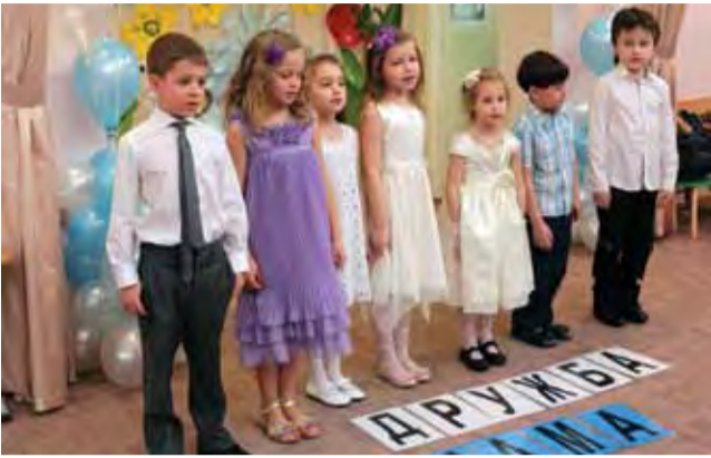
Главные слова жизни Ломоносовский детский сад