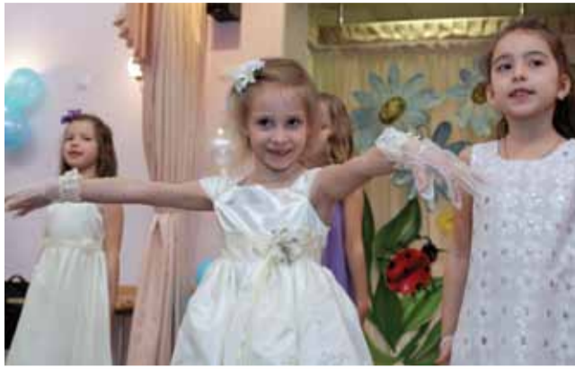
Первый бал Ломоносовский детский сад