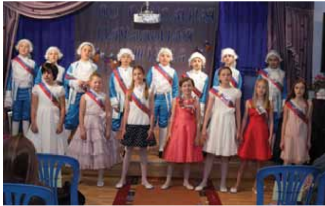
Самый спортивный 4в класс Начальная Ломоносовская школа