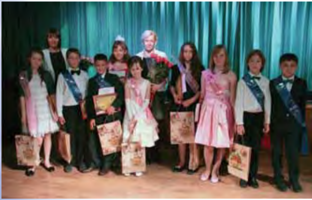
Мы с капитаном! Дальше поплывем! Полный вперед! Ломоносовская школа – Зеленый мыс