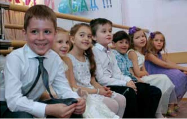
Главный праздник дошкольников Ломоносовский детский сад