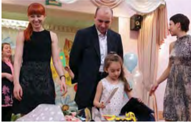
Родители помогут! Ломоносовский детский сад