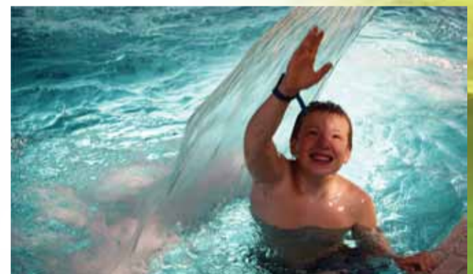
Первая межгалактическая экспедиция. В поисках воды