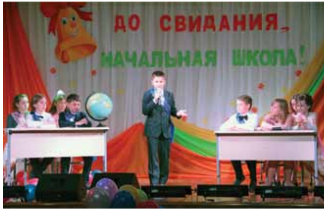
Ответ на пятерку! Ломоносовская школа – Зеленый мыс