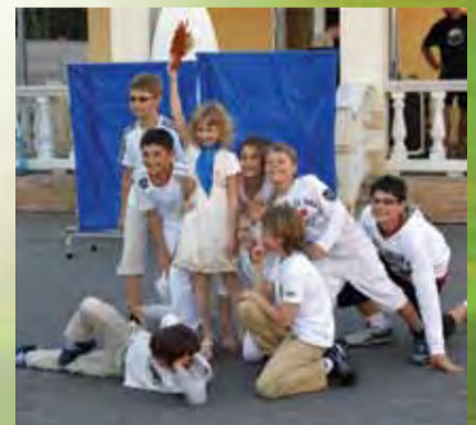
А в городе «Да» солнце светит всегда

Люди мира! Время переливает из ладони в ладонь ваши деяния, оставляя лишь значительные. Пусть молодое поколение принесёт земле процветание! Пусть славные дела поколений продолжатся в настоящем и проложат дорогу в будущее!