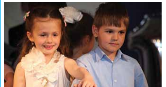
Счастливые минуты детства Нулевой класс Ломоносовской школы «ИнТек»