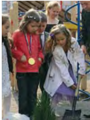
Расти, наша аллея! Ломоносовский детский сад