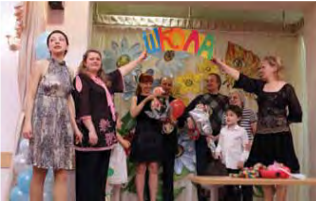
Весёлая школа Ломоносовский детский сад