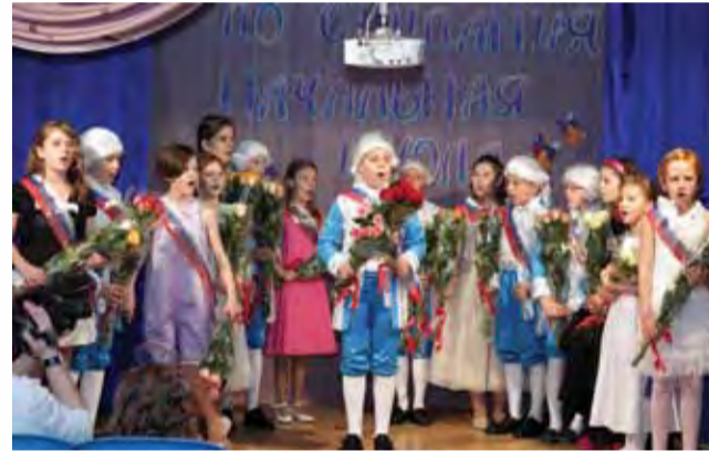
4а – Класс года – 2011 Начальная Ломоносовская школа