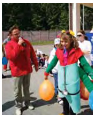
Ракета образца ручной сборки