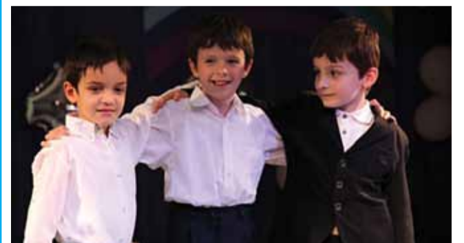
Мальчишеское братство Нулевой класс Ломоносовской школы «ИнТек»