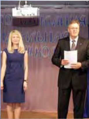
Приказ о переводе в пятый класс