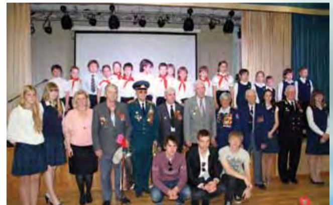
Акция «Подарок ветерану»