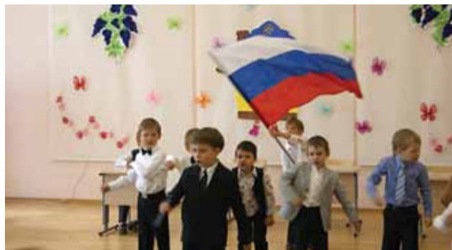
Мы – будущее страны! Детский сад Ломоносовской школы – Зелёный мыс