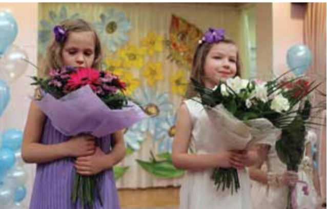
Цветы для тех, кто воспитывал и заботился Ломоносовский детский сад