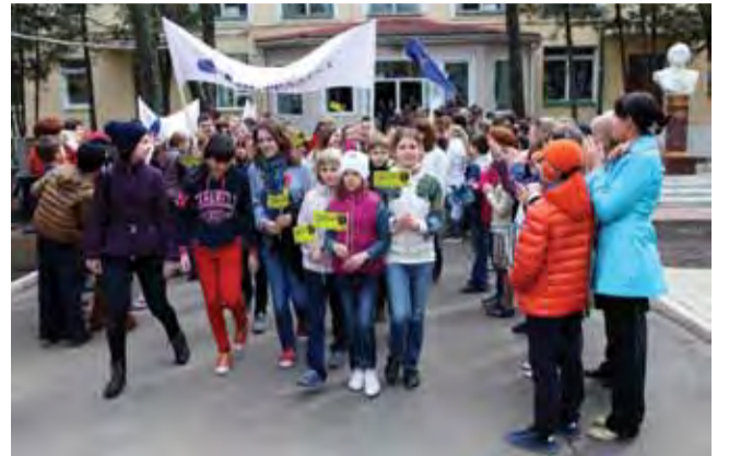
Ломоносовка провожает участников Олимпиады. 19.04.2012

— Это первая моя победа на Международной Олимпиаде!