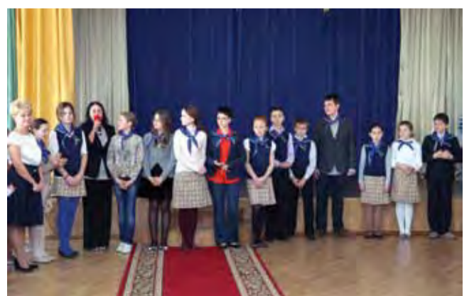
Герои дня. 24.04.2012