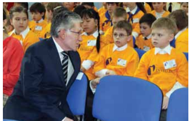
На волне «ИнтеллектТ»