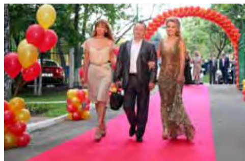
Красная дорожка - 2012