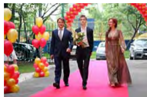
11 лет в Ломоносовке