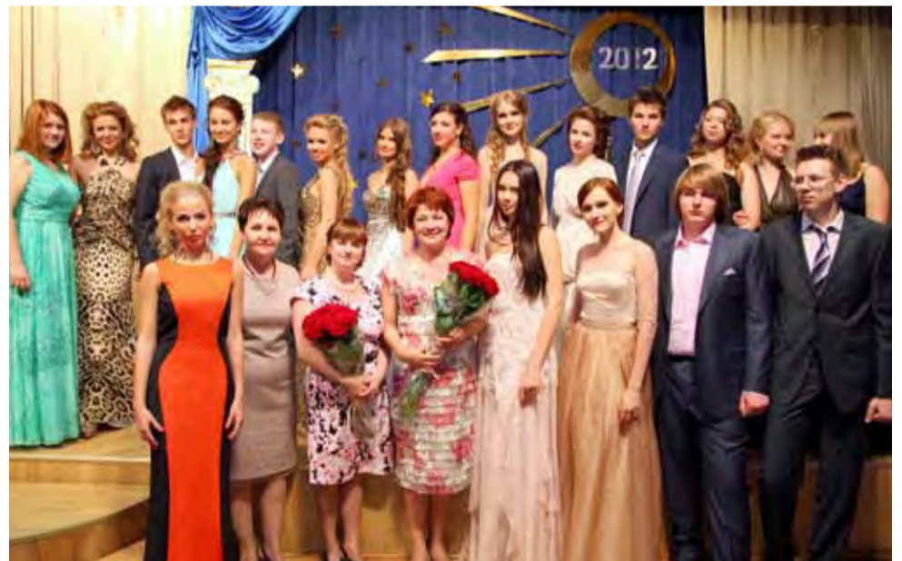
Выпуск— 2012. 5 золотых медалей!

Начальная школа будет грустить о замечательном выпуске. Ведь на протяжении четырех лет мы, сотрудники Начальной Ломоносовской школы, вместе с вами росли, радовались и плакали, учились и играли, достигали успеха и гордились. Мы — одна школьная семья. Помните, мы всегда ждем вас.