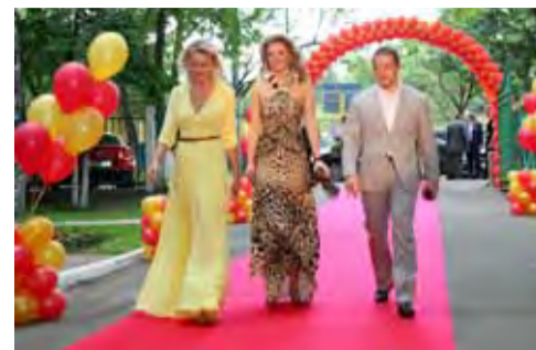
Главный праздник семьи