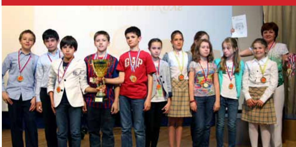
Самый спортивный класс 2012 года