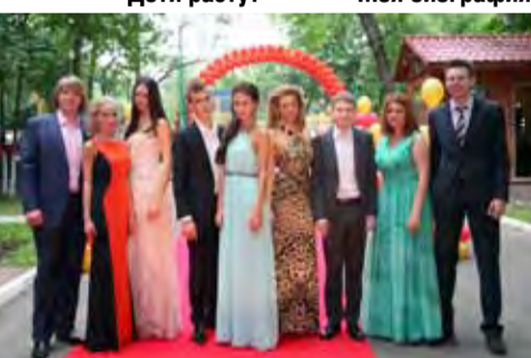
Мы не расстанемся!