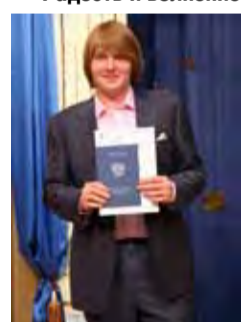
Я - выпускник!