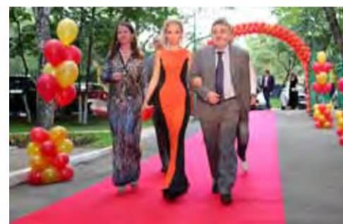
С уверенностью в жизнь