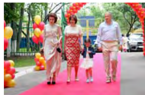
Дождь не посмел идти