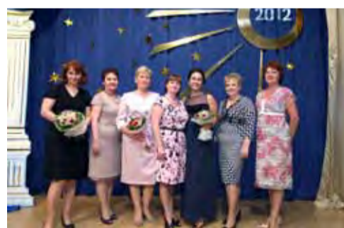
Это и наши медали!