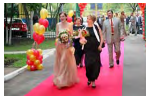
Окончен школьный роман