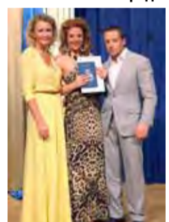
Радость и волнение