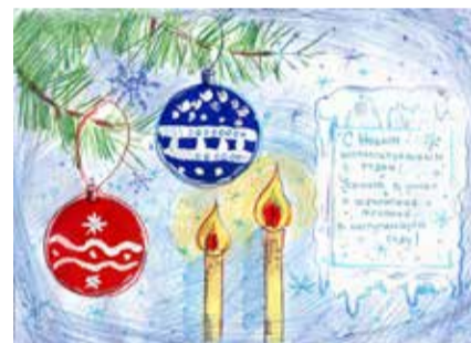
Рис. Анны Резановой