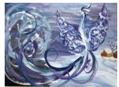
Рис. Ясмینی Наухановой