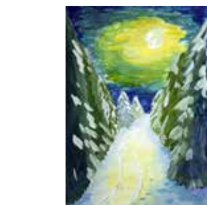
Рис. Иины Колесник