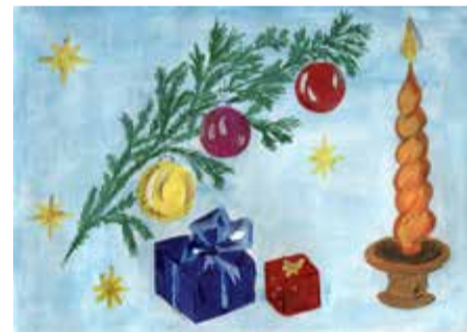
Рис. Таисии Беляевой