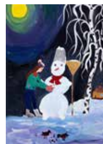
Рис. Алисы Кузеной