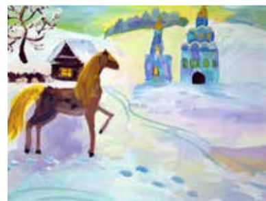
Рис. Владиславы Файдер