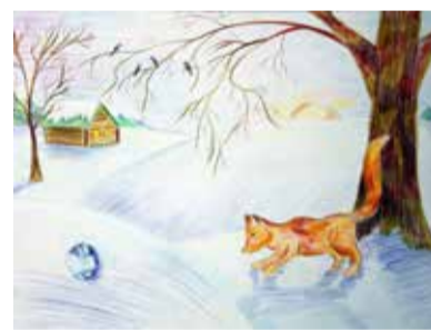
Рис. Евы Лушиной