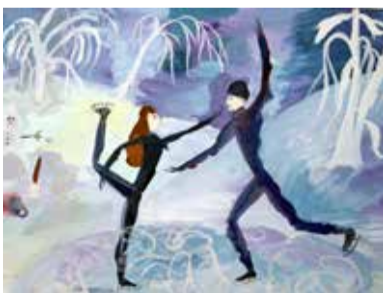
Рис. Таисии Яшечкиной