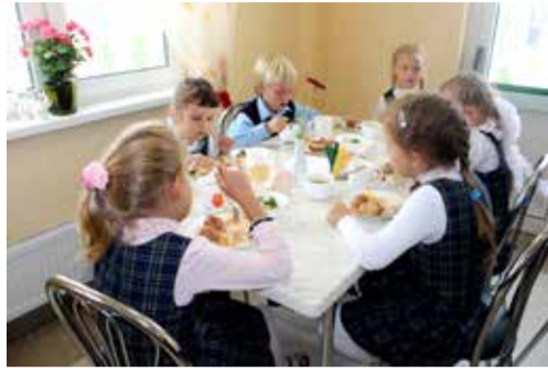
Загородная Ломоносовская школа — Зеленый мыс