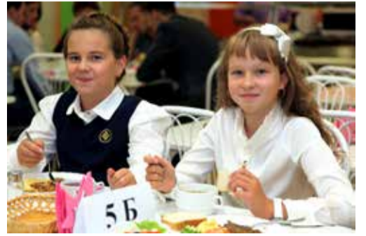
Загородная Ломоносовская школа «ИнТек»