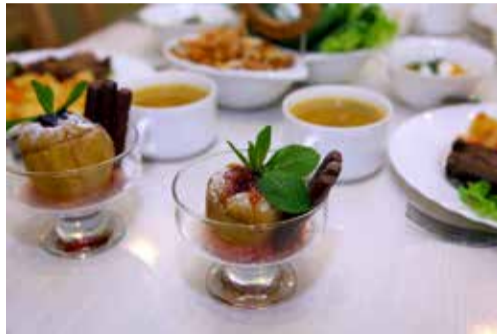
Питание в Ломоносовских школах