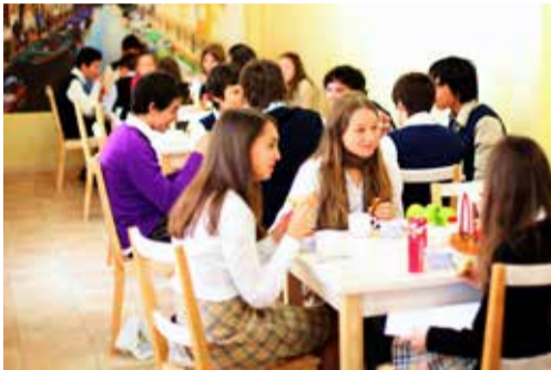
Городская Ломоносовская школа