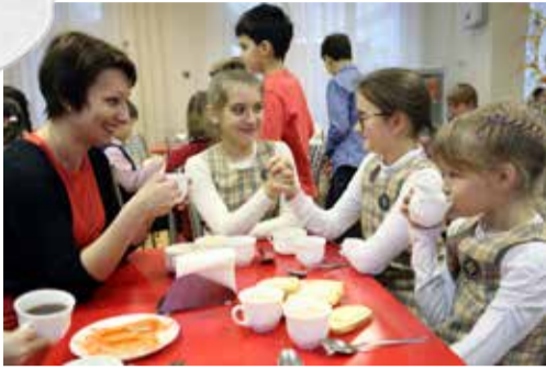
Начальная городская Ломоносовская школа