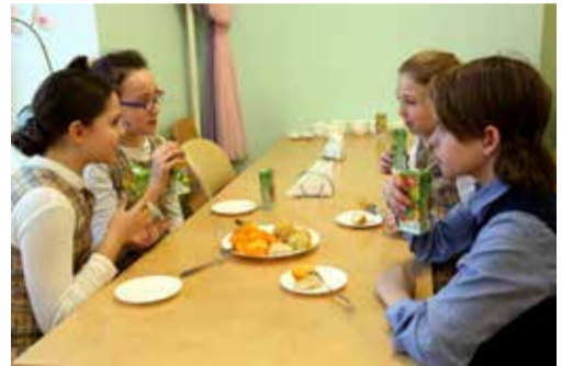
Загородная Ломоносовская школа №5