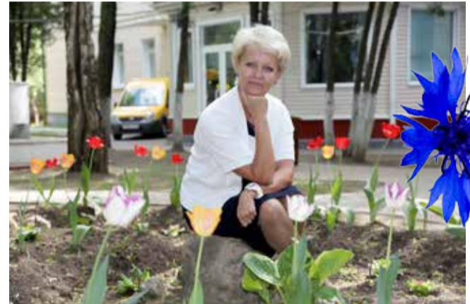
Ура! Скоро дето!