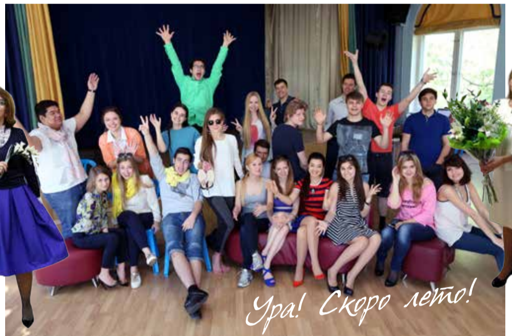
Ура! Скоро дето!