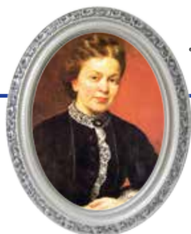
Баронесса Мария фон Эбнер-Эшенбах (1830-1916), австрийская писательница, драматург, автор психологических романов.

Только то, что слишком хорошо для современности, достаточно хорошо и для будущего.