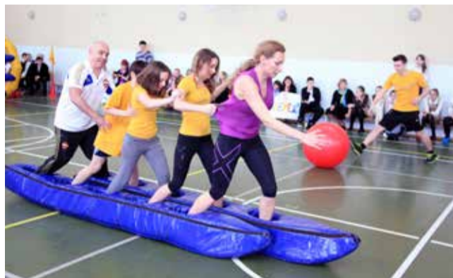
«Мама, папа, я – спортивная семья»