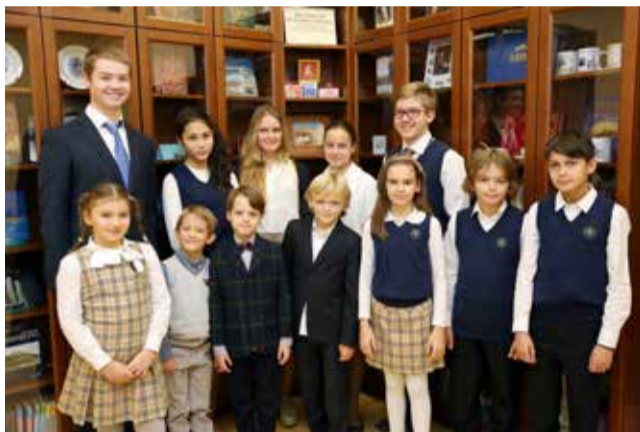
Ломоносовская школа №5