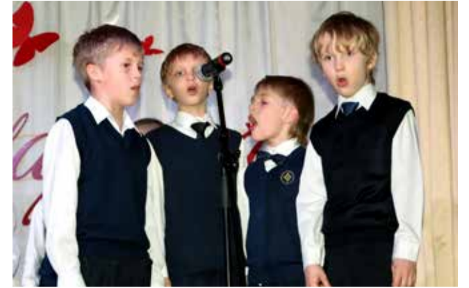
Ломоносовская школа — Зеленый мыс