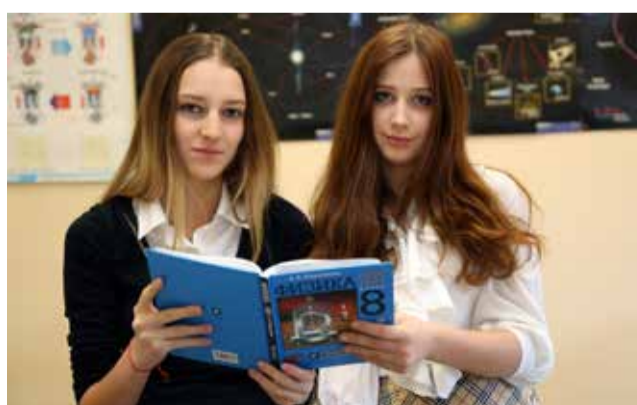
Ломоносовская школа №5