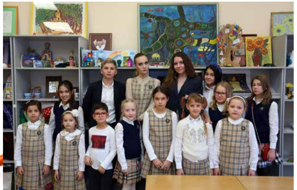
Ломоносовская школа №5