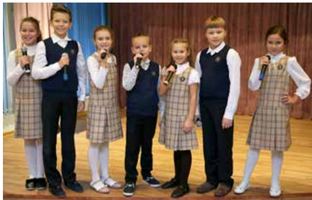
Ломоносовская городская начальная школа