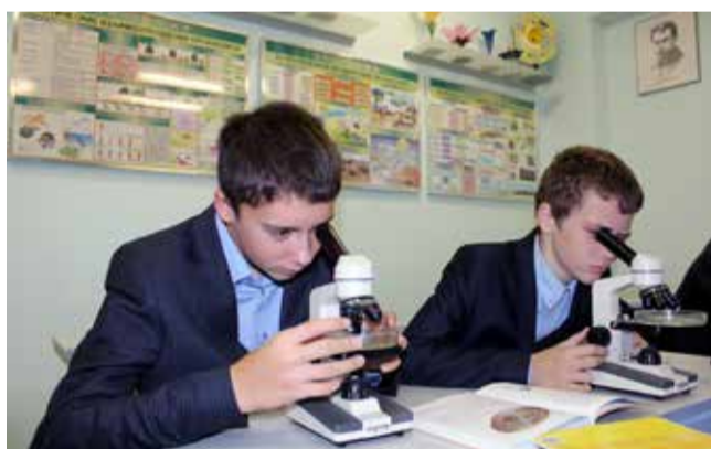
Ломоносовская школа — Зеленый мыс