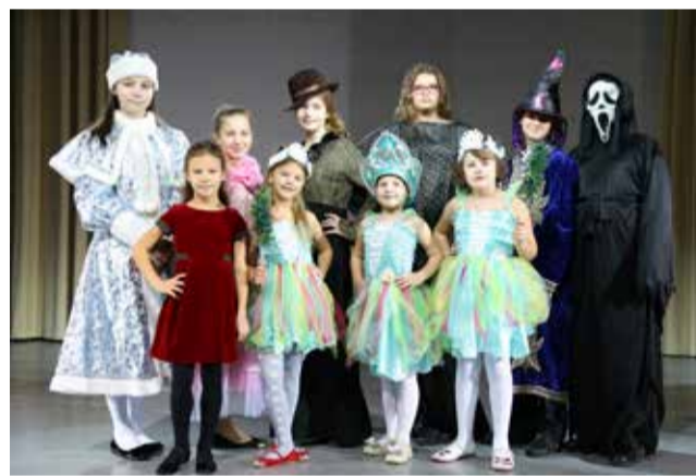
Ломоносовская школа №5