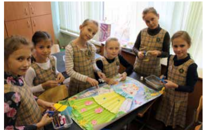
Ломоносовская городская начальная школа

Всеобщий закон — закон законов — это закон преемственности, ибо что такое в конечном счете настоящее, как не росток прошлого?