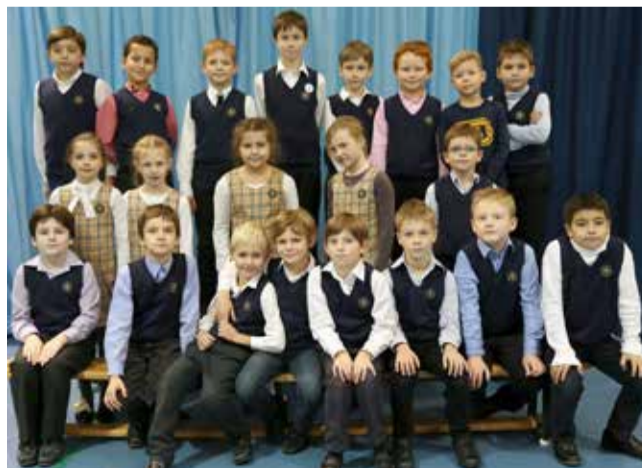
Ломоносовская городская начальная школа