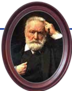
Виктор Марé Гюго (1802-1885), французский писатель (поэт, прозаик и драматург). Член Французской академии.