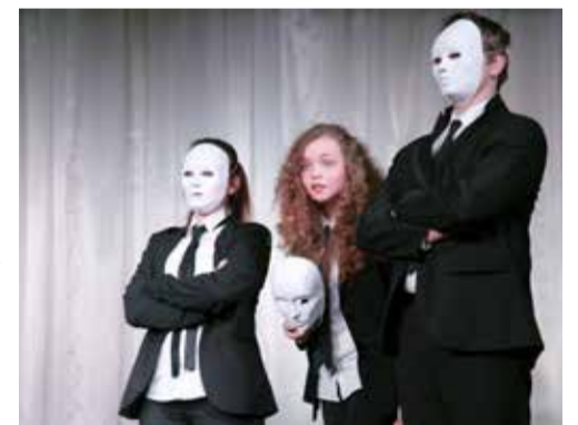
Ломоносовская школа — Зеленый мыс

занятий по основам актерского мастерства, риторике, сценическому движению. А итогом всех этих занятий являются разножанровые театральные постановки, которые наша студия показывает как в России, так и за рубежом. Ведь не случайно наши театральные коллективы не раз становились обладателями Гран-при театрального Фестиваля Холдинга «Ломоносовская школа», нашим юным актерам рукоплеска-