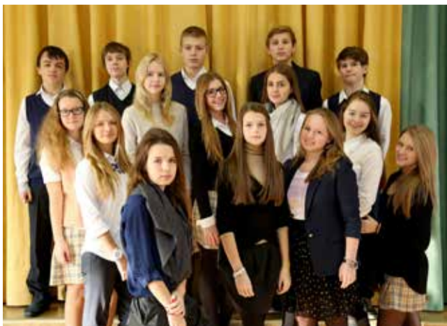
Ломоносовская городская основная и старшая школа