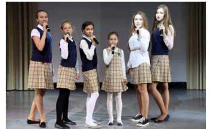
Ломоносовская школа №5