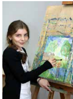
Ломоносовская школа «ИнТек»