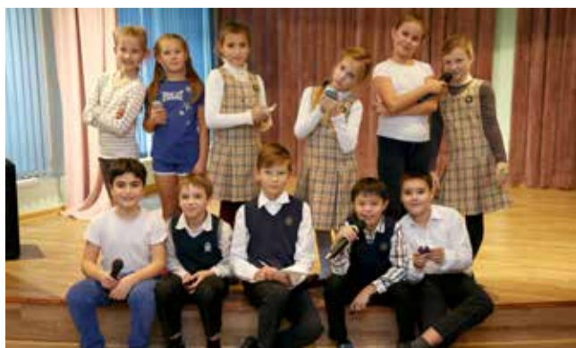
Ломоносовская начальная школа