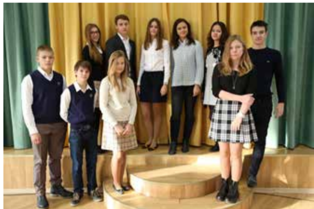
Ломоносовская городская основная и старшая школа