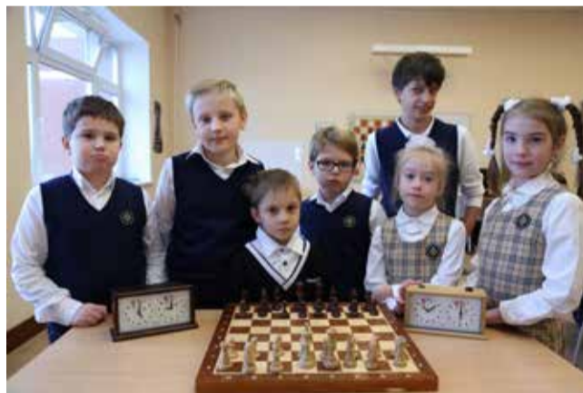
Ломоносовская школа №5

Воспитанники шахматной студии Ломоносовской школы «ИнТек»