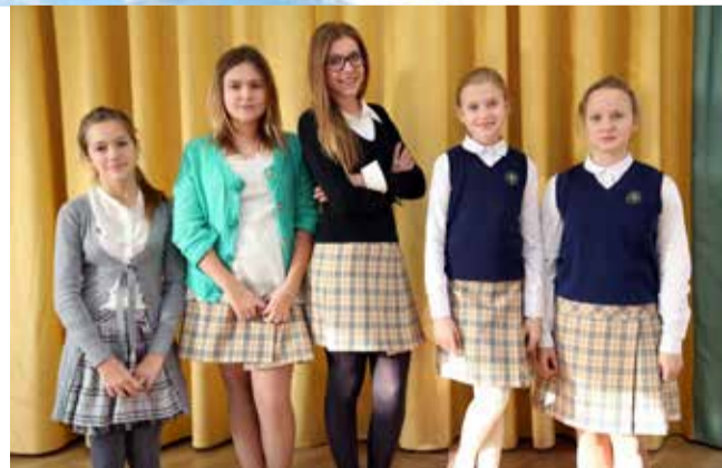
Ломоносовская городская основная и старшая школа