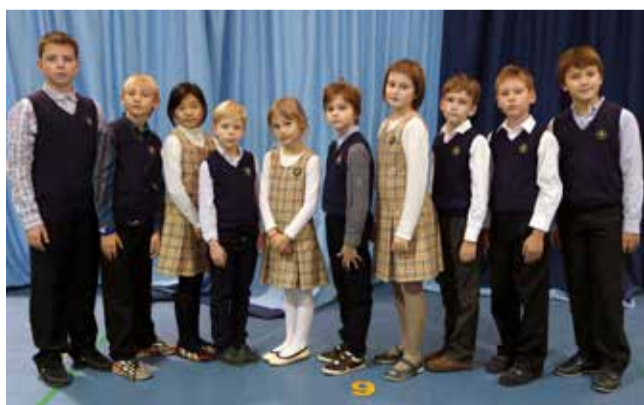
Ломоносовская городская начальная школа