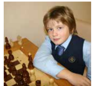
ЛШ — Зеленый мыс

Тем не менее, эта игра выдержала испытание временем лучше, чем все книги и творе-