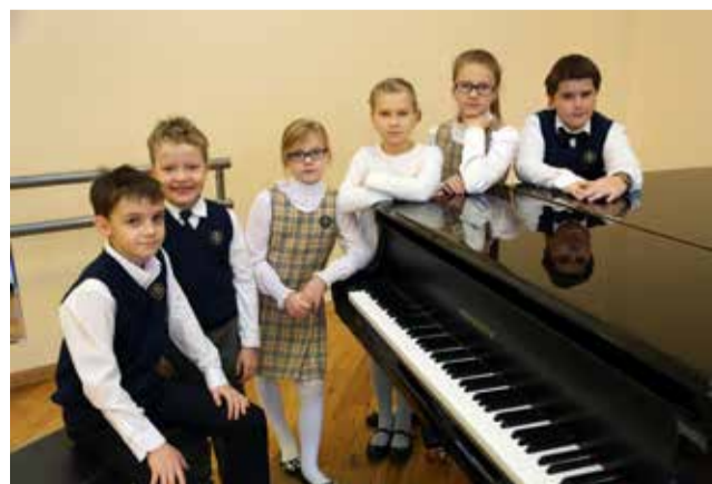
Ломоносовская школа №5