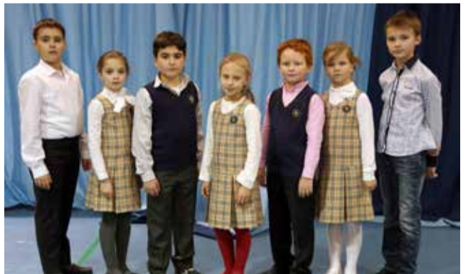
Ломоносовская городская начальная школа