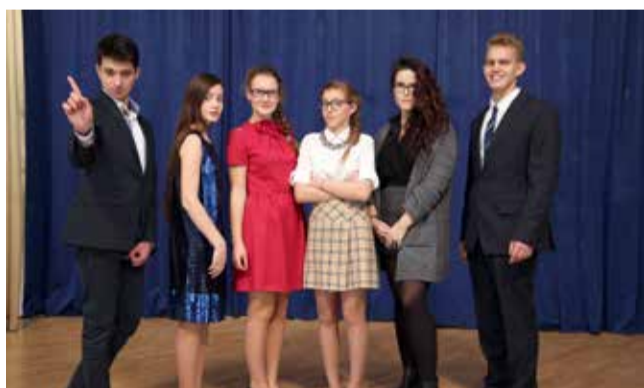
Ломоносовская городская основная и старшая школа