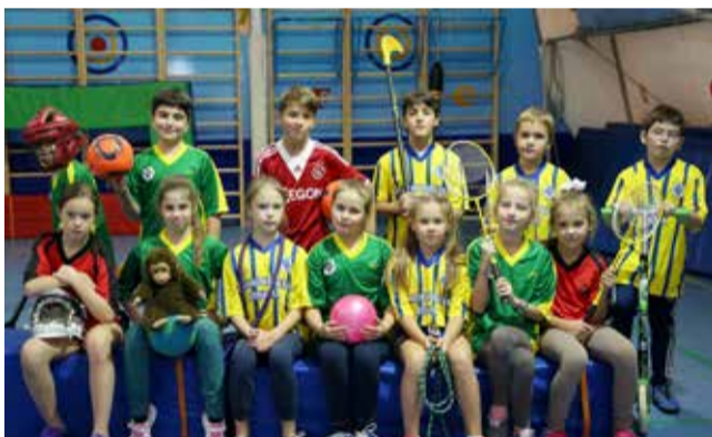
Спортсмены начальной Ломоносовской школы