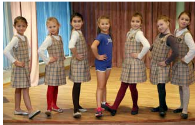
Ломоносовская городская начальная школа