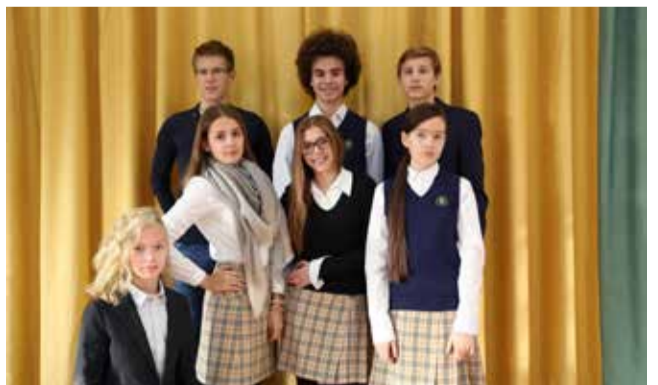
Основная и старшая ЛШ