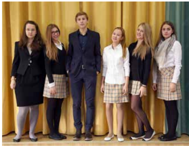
Ломоносовская городская основная и старшая школа