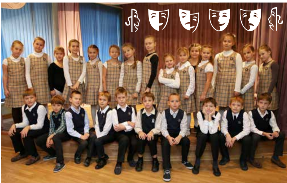
Ломоносовская городская начальная школа

«Для хорошего актера нет плохих ролей». Так говорил Иоганн Фридрих Шиллер. Ломоносовская школа «ИНТЕК» дает своим ученикам возможность попробовать себя в совершенно разных сферах творческой, спортивной и интеллектуальной деятельности, в том числе и в актерском мастерстве.