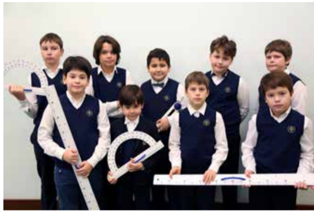
Ломоносовская школа №5