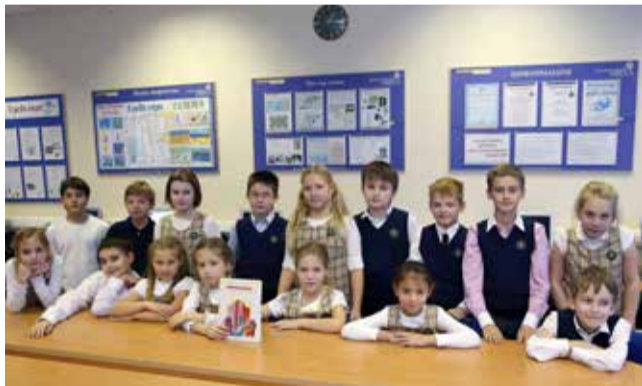
Ломоносовская городская начальная школа