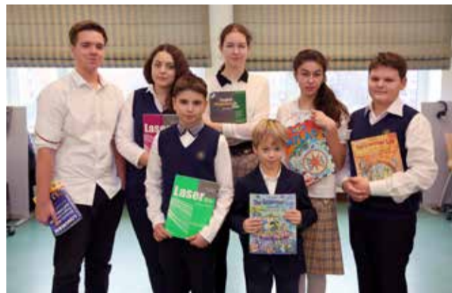
Ломоносовская школа №5