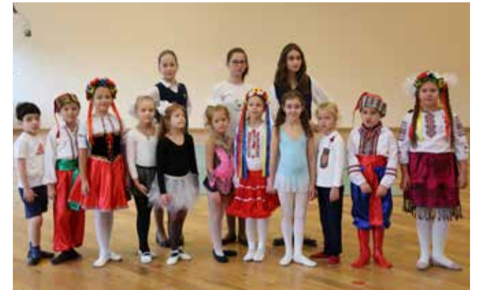
Ломоносовская школа №5