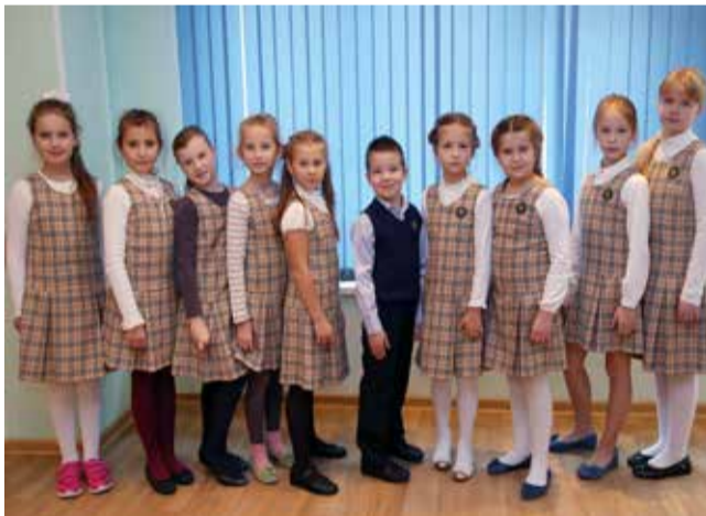
Ломоносовская городская начальная школа