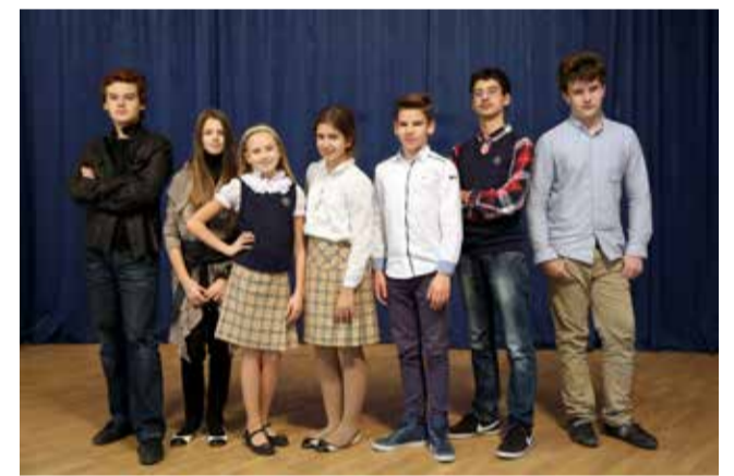
Ломоносовская городская основная и старшая школа