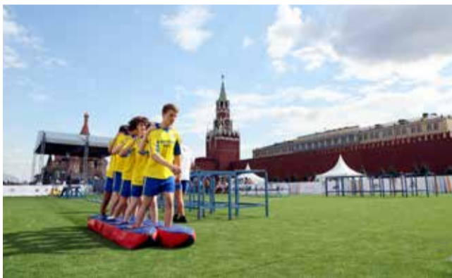
Сдача норм ГТО на Красной площади