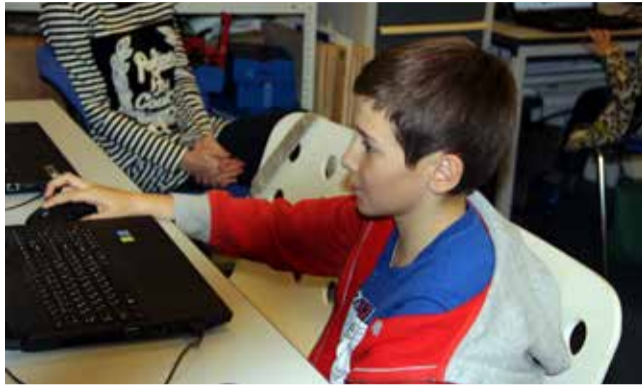
Ломоносовская школа «ИнТек»

Одним из основных трендов нового тысячелетия можно считать активное внедрение информационных технологий во все сферы деятельности человека. Современному человеку недостаточно быть технологически грамотным: уметь работать в офисных приложениях, графическом редакторе, в сети Интернет. Мы должны уметь использовать ИКТ, чтобы успешно сотрудничать с людьми, решать возникающие задачи и учиться в течение всей жизни. Формированием информационной культуры, компьютерной грамотности мы занимаемся на уроках информатики и ИКТ. В старшей школе на профильном курсе информатики