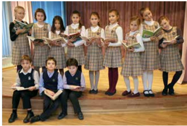
Ломоносовская городская начальная школа