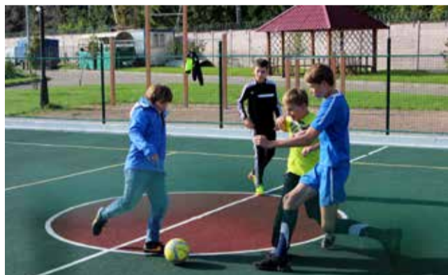
Спортсмены Ломоносовской школы – Зелёный Мыс