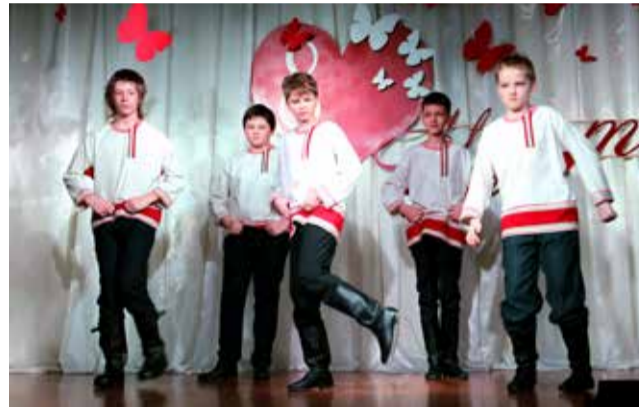
Ломоносовская школа — Зеленый мыс