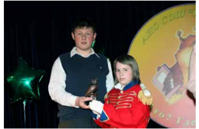
Ломоносовская школа «ИнТек»