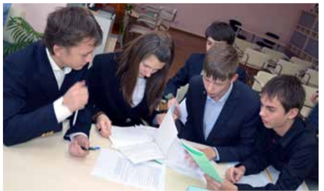
Ломоносовская школа — Зеленый мыс