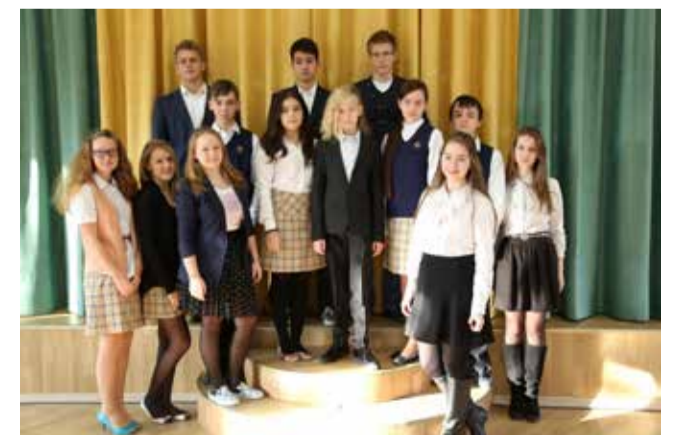
Ломоносовская городская основная и старшая школа