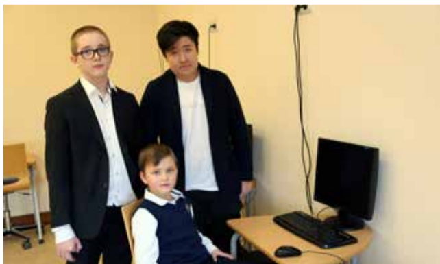
Ломоносовская школа №5