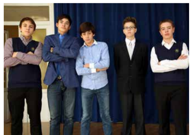
Ломоносовская городская основная и старшая школа

Далеко не достаточно показать, что настоящее выше прошлого: нужно еще вызвать предчувствие будущего, которое выше нашего настоящего.