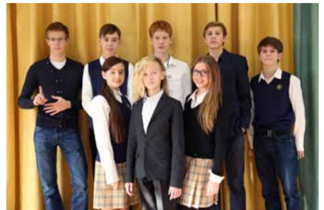
Ломоносовская городская основная и старшая школа