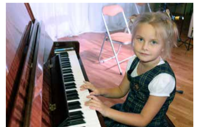
Ломоносовская школа — Зелёный мыс

Музыкальные педагоги Ломоносовской школы №5