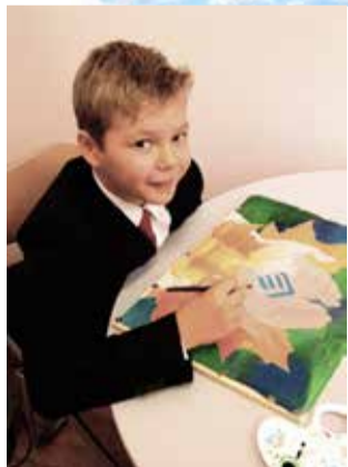
Ломоносовская школа — Зеленый мыс