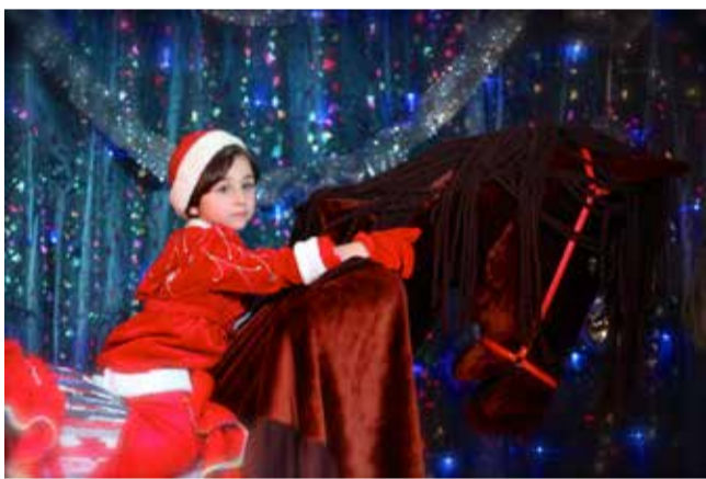
Ломоносовская школа «ИнТек»