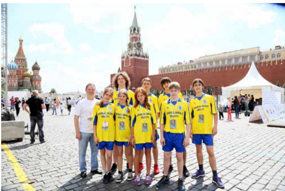
Сдача норм ГТО на Красной площади