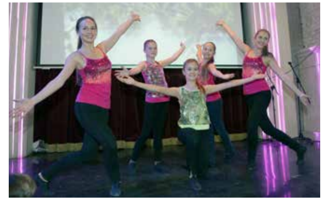
Ломоносовская городская основная и старшая школа