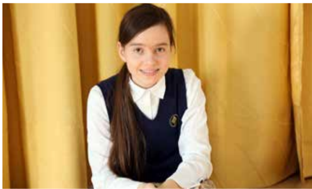
Ломоносовская городская основная и старшая школа