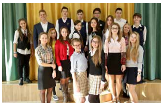
Ломоносовская городская основная и старшая школа