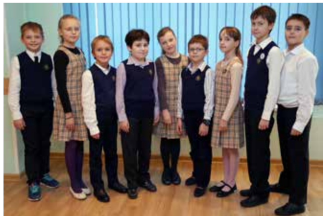
Ломоносовская городская начальная школа