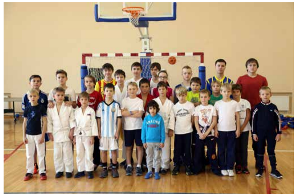
Спортсмены Ломоносовской школы № 5

Самое удивительное в будущем – это мысль о том, что наше время будут называть старыми добрыми временами.