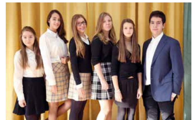
Ломоносовская городская основная и старшая школа