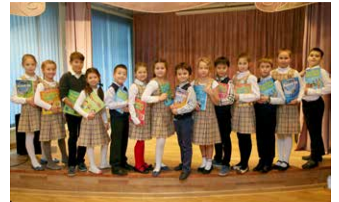
Ломоносовская городская начальная школа