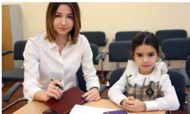
Ломоносовская школа №5

Редакция газеты «Зелёный мыслитель» Ломоносовская школа — Зелёный мыс