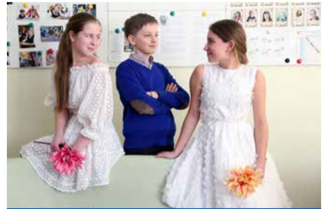
ПОЛИЛОГ О КРАСОТЕ

Весной у меня всегда прекрасное настроение, потому что именно в это время года проходит множество моих любимых праздников. Так, весной день рождения у меня и у моей мамы. Я понимаю, что зима будет уже только в следующем году, а лето ещё впереди. Это придает мне сил в учебе и делает меня счастливой.