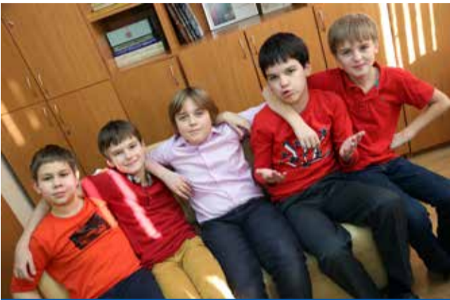
ПИСЬМО ГЛАВНОГО РЕДАКТОРА

Дорогие ломоносовцы, вы держите в руках первый в этом году номер нашей газеты. Весна — время перемен, а значит — отличный повод, чтобы впустить в свою жизнь что-то новое и важное. Перемены коснулись и газеты «Ломоносовец» — мы постарались сделать ее еще более интересной и полезной для вас, школьников, ваших родителей и сотрудников.