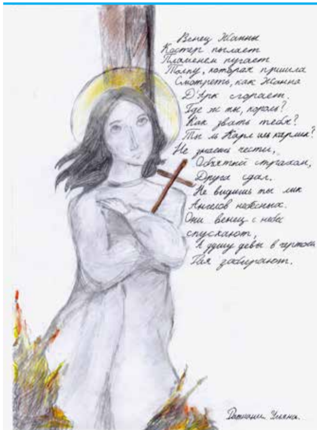
Ульяна Ратиани, Ломоносовская школа №5