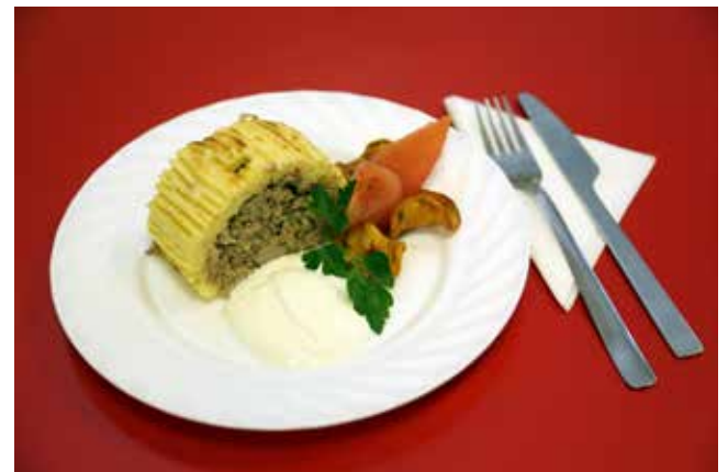
ЗАПЕКАНКА КАРТОФЕЛЬНАЯ С МЯСОМ «ЛОМОНОСОВСКИЙ СЕКРЕТ» (на 4-5 порций) Картофель отварной очищенный — 0,7 кг; Говядина (индейка, курица) — 0,3 кг; Лук жареный — 100 гр; Яйцо — 1 шт; масло сливочное — 20 гр; Хурма (для украшения) — 1 шт.; соль, перец — по вкусу.