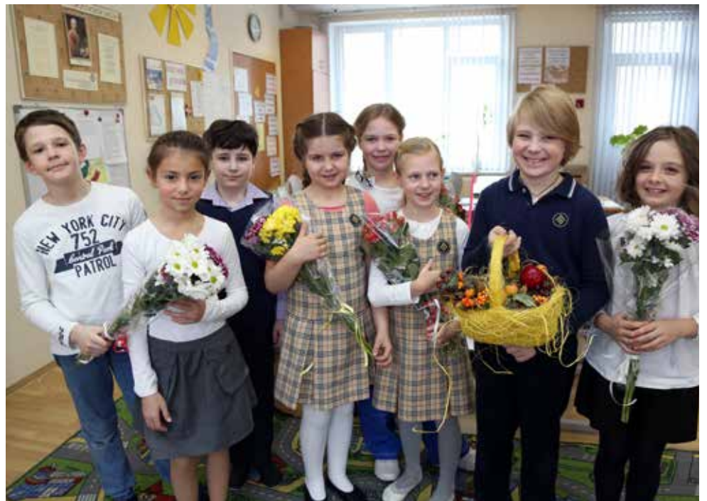
Ученики 2 «Б» класса Городской начальной Ломоносовской школы

11-й класс закончил ты, Как быстро это время пролетело! И в прошлом школа. В будущем — мечты, Ты к ним шагай во взрослой жизни смело. Хотим тебе удачи пожелать, Достойным человеком оставаться, И в этой жизни все превозмогать, Счастливым быть и чаще улыбаться!