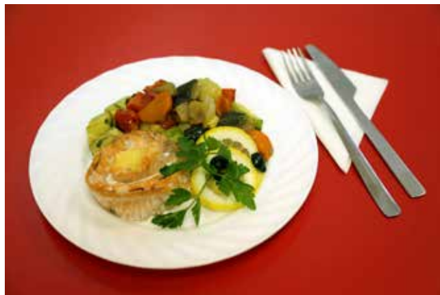
РОЗА ЗНАНИЙ (на 4-5 порций) Филе семги — 0,8 кг; Сыр — 100 гр; Зелень — 20 гр; Соус — 100 гр; Масло оливковое — 20 гр; Соль, перец, лимонный сок — по вкусу.