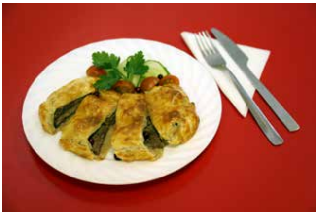
МЯСО «ПО-ЛОМОНОСОВСКИ» (на 4-5 порций) Вырезка говяжья — 0,5 кг; Тесто слоеное — 0,5 кг; Яйцо — 1 шт; Свежие овощи (помидор, огурец, болгарский перец) — для украшения; Соль, специи — по вкусу.