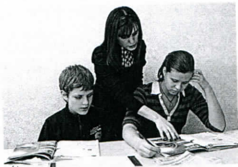
В школе должно быть создано образовательное пространство, способное обеспечить развитие внутреннего деятельностного потенциала ученика.

В школе должно быть создано такое образовательное пространство, которое способно обеспечить развитие внутреннего деятельностного потенциала ученика; способностей, необходимых для стандартных учебных действий, обеспечивающих успех в учебе; способности быть автором, творцом, активным созидателем своей жизни; умения ставить цели и искать способы их достижения; потребностей к свободному выбору и ответственности за результаты такого выбора, а также создание условий для максимально возможного использования обучающимися своих способностей; ограждения от негативного влияния на ребенка с признаками одаренности «обычных» реакций детей; постоянного стимулирования позитивного проявления способностей.