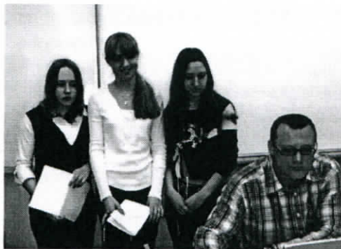
Курсы по выбору позволяют часть времени отдавать изучению предметов, соответствующих особым интересам одаренных детей.

Особым образом организованная воспитывающая среда школы позволяет создавать у обучающихся мотивацию к выработке активной жизненной